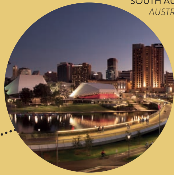
ADELAIDE, SOUTH AUSTRALIA AUSTRALIA