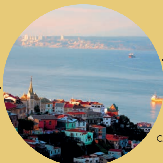
VALPARAISO, CASABLANCA VALLEY CHILE