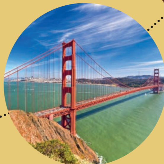
SAN FRANCISCO, NAPA VALLEY UNITED STATES