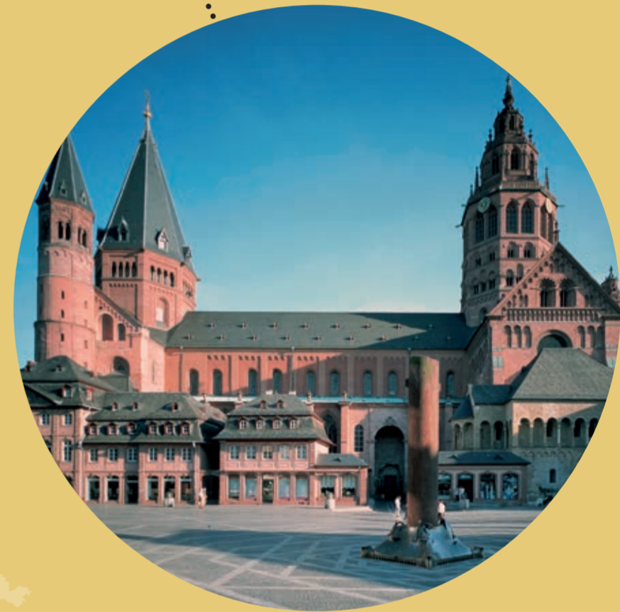
MAINZ, RHEINHESSEN GERMANY